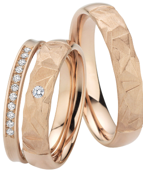
6 | Eishauch / Liebesversprechen