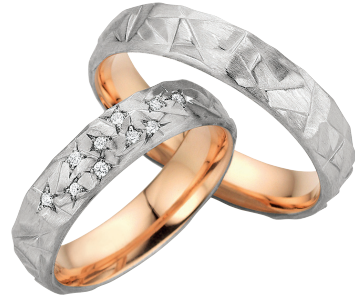
12 | Eisglitzer