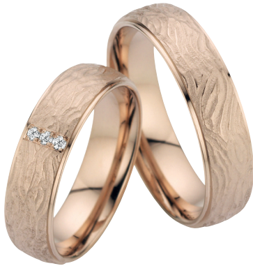
13 | Wüstenzauber