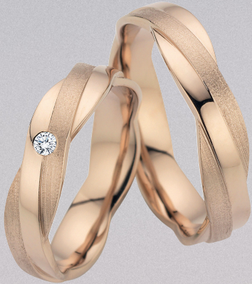
15 | Seelenband