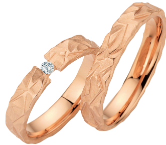
5 | Eisbrücke

Die kunstvolle Struktur erinnert an filigrane Eiskristalle, während warmes Caramelgold eine sanfte Eleganz verleiht.