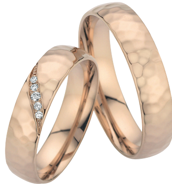
14 | Dünenglanz

Die sanft strukturierte Oberfläche spiegelt die Wellen des Sandes im Sonnenlicht wider. Feinste Goldtöne und präzise Handwerkskunst machen diesen Ring zu einem Symbol für zeitlose Eleganz und Verbundenheit