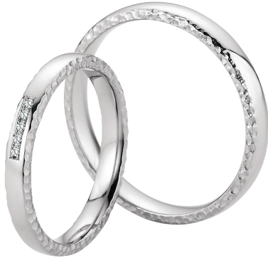
7 | Frostzauber

Frostzauber – die Magie des Winters in einem Ring. Der Rand erinnert an funkelnde Eiskristalle, edles Weißgold und Brillanten verleihen dem Ring eine zeitlose Eleganz.